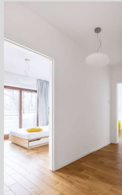
ฝ้าเพดาน และผนังทั่วไป

Thai Gypsum Products Pcl. Gypsum Metropolitan Tower 539/2 Si Ayutthaya Road, Thanon Phayathai, Ratchathewi, Bangkok 10400 Thailand Tel: +66(2) 700-9444