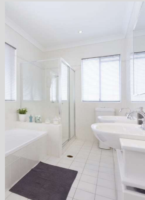
ฝ้าเพดาน และผนังภายในห้องน้ำ, ห้องครัว